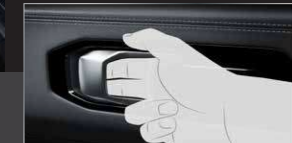
มือจับประตูทรง 3 มิติ ใช้งานง่าย (INTUITIVE HANDLE)