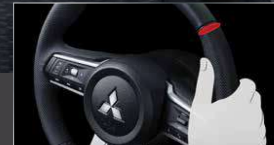
พวงมาลัยจับนกดมือ (FITTED STEERING WHEEL)