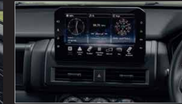
หน้าจอระบบสัมผัส 10 นิ้ว (10-INCH INFOTAINMENT SYSTEM) พร้อมรองรับ Bluetooth, Apple CarPlay II & Android Auto เชื่อมต่อทุกความบันเทิงได้อย่างง่ายดาย