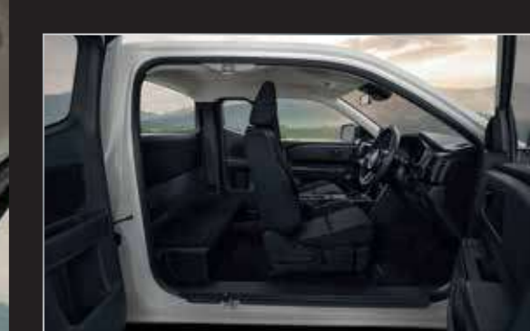
ห้องโดยสารขนาดใหญ่ ประตูเปิดกว้าง ขึ้น-ลง สะดวก โปร่งโล่ง สบาย ให้ทัศนวิสัยที่ยืดเยื้อ